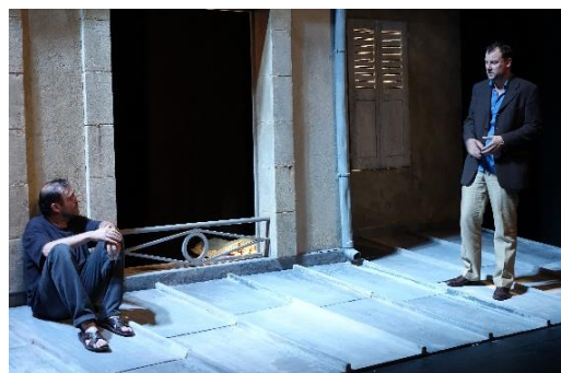
Livret de famille