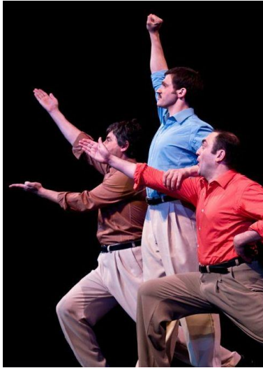
Nuit Blanche chez Francis

La Belle Equipe voit le jour en 2007 et donne naissance au projet Nuit Blanche chez Francis , spectacle unanimement salué par la critique et les professionnels avec près de 300 représentations (Lucernaire, Vingtième Théâtre, Théâtre des Béliers Parisiens et en tournée en France et à l'étranger...)