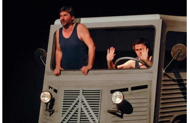
Yanne a marre

La Belle Equipe est soutenue par le Conseil Régional Occitanie et la Mairie de Toulouse.