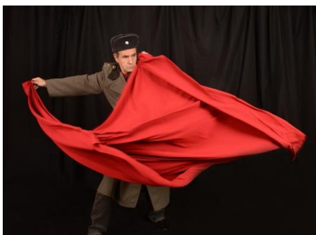
Propaganda - Fantaisie soviétique